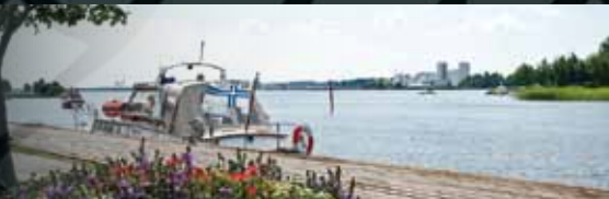
Tervasaari • Kuvaaja Janne Leppänen