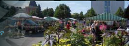
Kauppatori • Kuvaaja Mikko Ranki