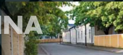
Vanhaa keskustaa