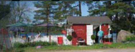
Huutjärven uimaranta